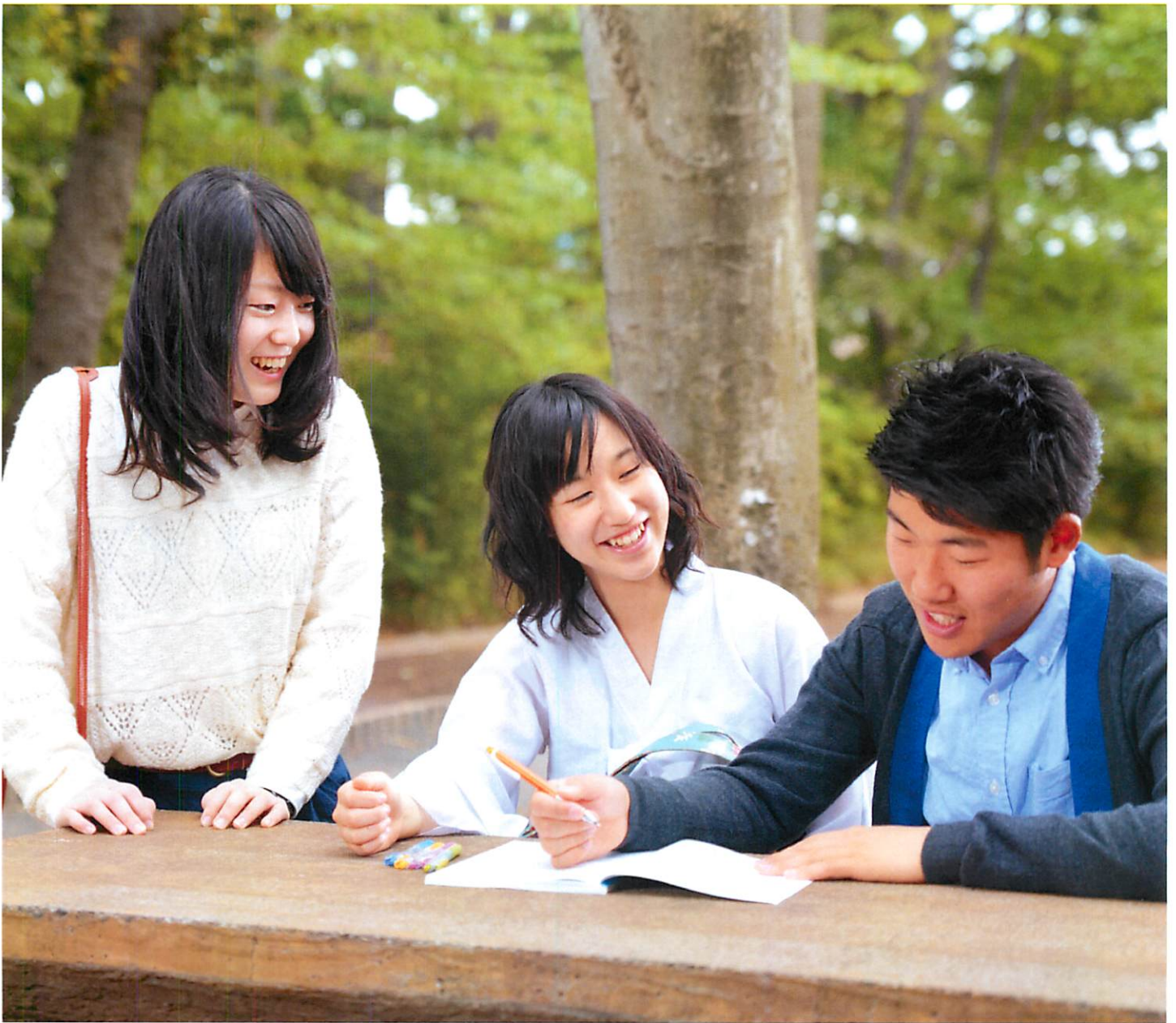
고교 재학 시에 장학금을 수급하고 오늘도 공부에 열중하는 대학생들

The Foundation for Korean Students in Japan