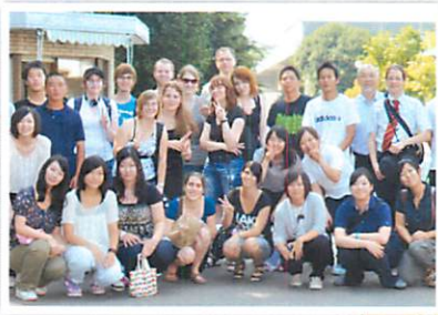
◀ 학술문화교류 (독일)