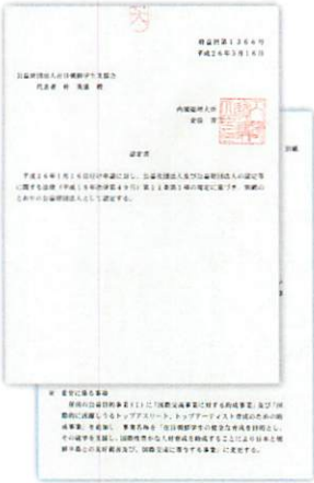
총리대신 명의 인정서

재일 코리안 학생들의 배움의 기회를 보장하고 학업을 도와주고 싶다는 마음에서 발족한 본 재단도 벌써 4 기째를 맞이하게 되었습니다.