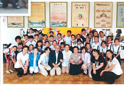
▶ 제 12 회 남북조선과 일본의 어린이전

건전한 청소년 육성과 국제 감각의 함양 등 교육적인 견지에서 재일 코리안 학생들이 참가하는 국제 교류 사업에 대한 지원을 실시합니다.